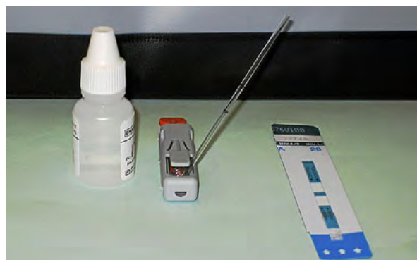
Kit utilizado para hacer las pruebas.

Con datos fechados a octubre de 2009, 36 boticas barcelonesas llevaron a