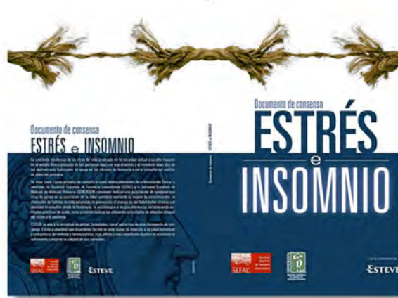
Portada y contraportada de la guía sobre estrés e insomnio.

Con esta iniciativa se respalda la valiosa actuación del farmacéutico cen-